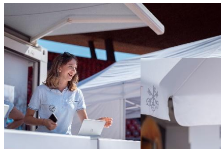
Bons de repas de UBS & Cadeaux pour les participants (Montage chez ASICS, retrait chez UBS)