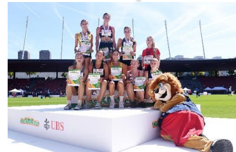
Remise de prix (Rang 1-8)