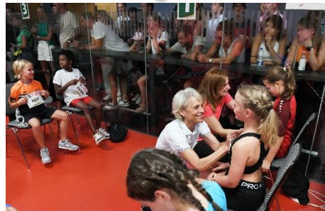
Callroom (distribution dossard)