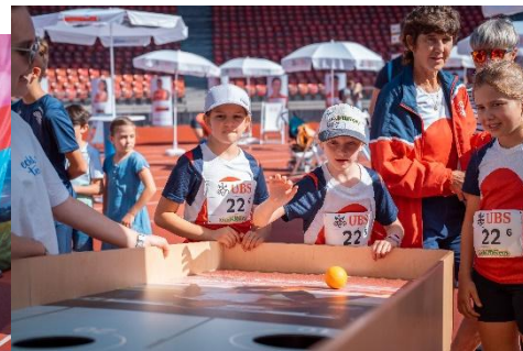
Jeux & divertissement