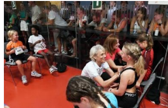
Callroom (Verteilung Startnummer)