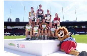
Siegerehrung (Rang 1-8)