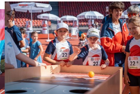
Neue Haas Unica Pro