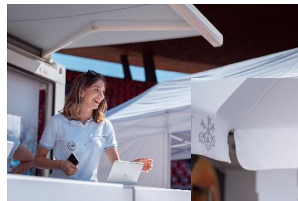
UBS-Verpflegungsbons & Geschenke für Teilnehmende (Anprobe bei ASICS, Abholung bei UBS)