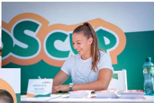
Autogramme & Selfies