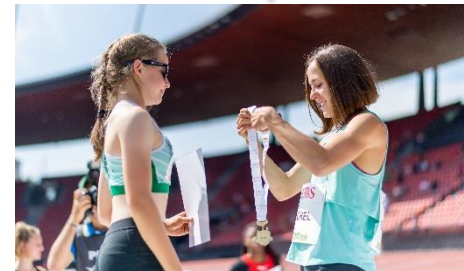
Premiazione di vincitori